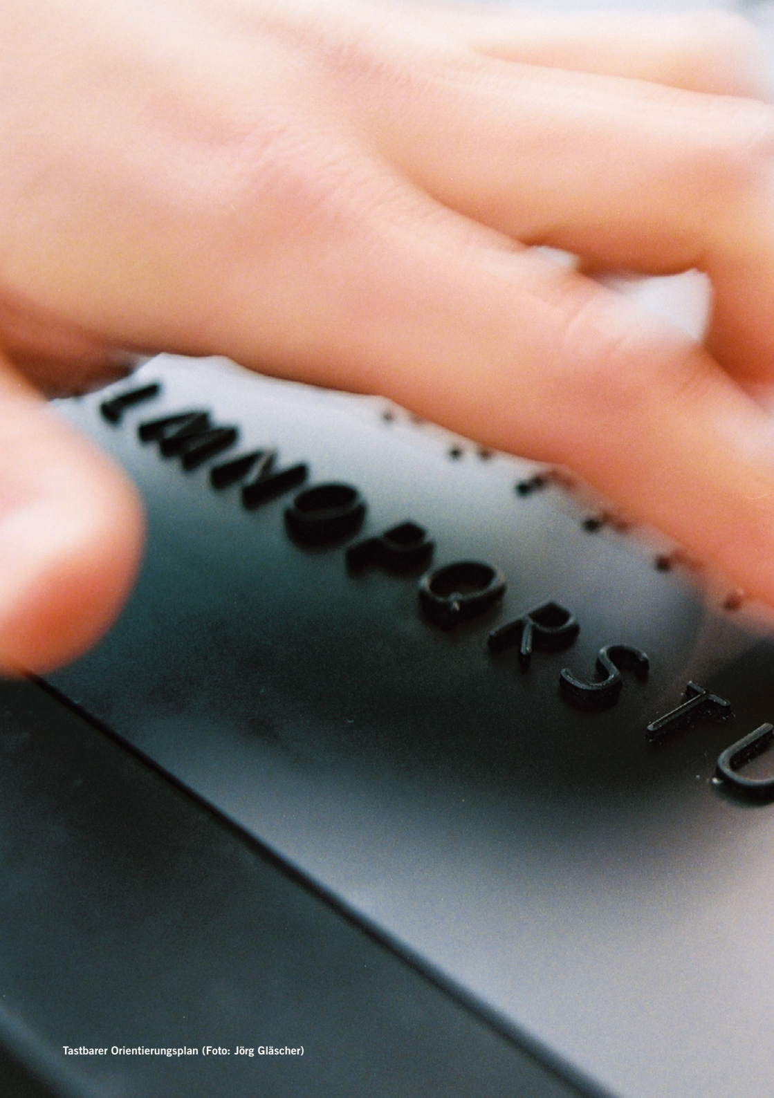
Tastbarer Orientierungsplan